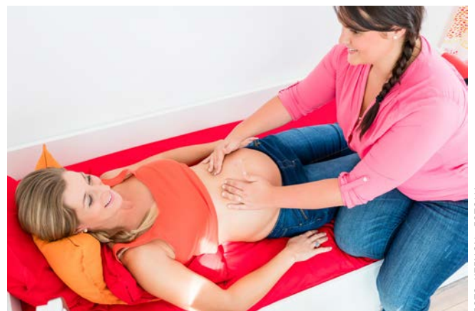
HEBAMMEN SORGEN FÜR EINE GUTE BETREUUNG SCHWANGERER.

„Frauen finden keine Hebammen und fühlen sich mutterseelenallein, mit 1000 Fragen, Sorgen und Unsicherheiten. Wir fordern Hilfe für einen guten Start ins Leben.“