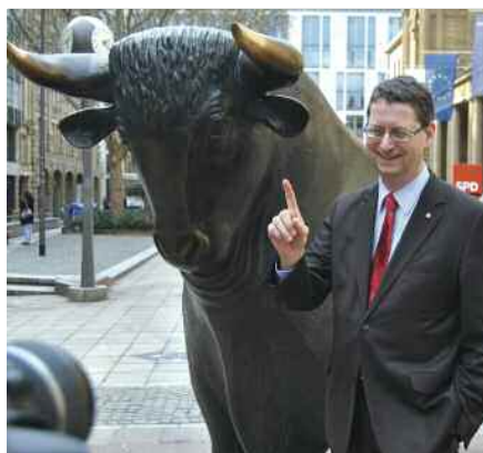
„Die Börsenfusion schädigt den Finanzplatz Frankfurt.“

Die Einigung im Tarifstreit zwischen den öffentlich Beschäftigten des Landes Hessen und der Landesregierung Anfang April hatte Rudolph begrüßt. Er zeigte sich erfreut, dass die Tarife der hessischen Beschäftigten nun endlich auch denen der anderen Bundesländer angepasst worden waren und gratulierte den Gewerkschaften des öffentlichen Dienstes für diesen Verhandlungserfolg. ■