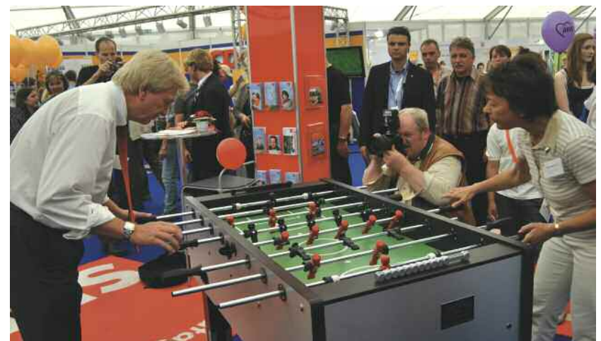
Sportliche Auseinandersetzung am Tischkicker zwischen der stellvertretenden SPD-Fraktionsvorsitzenden Brigitte Hofmeyer und Innenminister Bouffier (CDU).