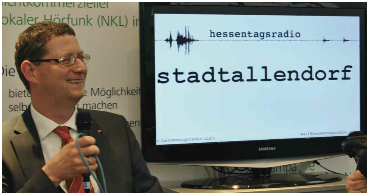
Über eine Million Menschen besuchten den 50. Hessentag in Stadtallendorf. Zu einem Magneten entwickelte sich für 460.000 Besucher die Landesausstellung in Halle 1, aus der das Hessentagsradio rund um die Uhr mit den Radiomachern der nicht kommerziellen Lokalradios viele Livereportagen sendete.