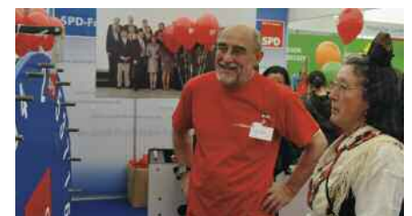
Ein gelungenes Landesfest zwischen Tradition und Moderne