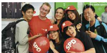
Der Hessentag, der dieses Jahr im Zeichen der Integration stand, führt Menschen aller Nationen zusammen.