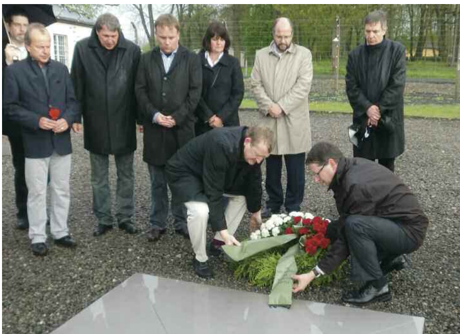
Kranzniederlegung in Buchenwald am Denkmal für die Häftlinge des ehemaligen Konzentrationslagers. Überlebende Häftlinge hatten an dieser Stelle nach der Befreiung am 19. April 1945 das erste Denkmal errichtet.