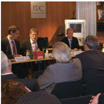
Im Dialog mit Managern, Wirtschafts- und Finanzfachleuten