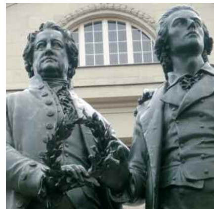
Goethe und Schiller in der Kulturstadt Weimar