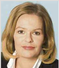
Nancy Faeser, Mdl.