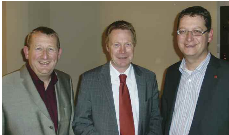
Treffen der SPD-Fraktion mit dem stellvertretenden Thüringer Ministerpräsidenten Christoph Matschie in Weimar.

Ein Schwerpunkt der Fraktionsklausur war die künftige Finanzpolitik im Zeichen der ab 2020 geltenden Schuldenbremse. Prof. Dr. Peter Bofinger, Mitglied des Sachverständigenrats zur Begutachtung der gesamtwirtschaftlichen Entwicklung und einer der „fünf Wirtschaftsweisen“, fand für seine Forderung, dass die Schulden-